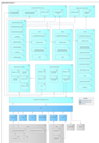
Obrázok 3 - Aplikačná vrstva architektúry IS REPLIK

Z funkcionality týchto modulov a iných východiskových podkladov sú nižšie odvodené a formulované požiadavky na systém, architektonické princípy a návrh architektonických vrstiev.